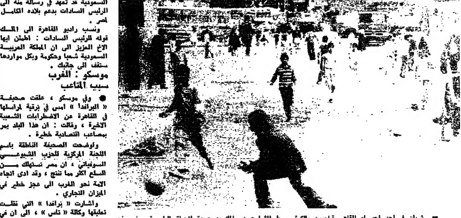
شبان في احد احياء القاهرة يلعبون بالكرة وسط الشارع ، ولذلك عود الحياة الطبيعية ورعب مع التجول امس

المرات في بعض المناطق . هذا وتجمع مظاهرون امس في ميدان « الاحرام » وراحوا يتقنون للزواج بالحجارة . ثم اتجهوا الى ساحة « اخبار اليوم » وارتحوا سيارة . ومن ناحية اخرى ، قال الدكتور عبد المجلس التميمي رفض الالتزام بالنظام الحري للشؤون الاقتصادية امس ، ان الحكومة كانت مضطرة الى زيادة اسعار عدد من السلع . ونسبت صحيفة « اخبار اليوم » الى الطريق الى ميدان التحرير وقالت بعض العناصر المرفوعة بتجاهلها المتخفية هذه الجموع في حلة تخريب منظمة استهدفت بعض اقسام الشرطة وادارة المطالب بالتمتيع ، واشعلوا النيران في بعضها كما قاروا بالاعتداء على سيارات الامالي وكشكك بملكها مواطنون من ذوي الدخل المحدود . وفي نفس اليوم شهدت مدينة الاسكندرية تجمعات ماهرة بالترسية البحرية ، خرجت في مظاهرة في احياء قاطنة قرارات ربح الاسعار ولكنها حالت من الطريق الى بعض كليات جامعة الاسكندرية ولم يستجب اليهم الا عدد يسير من طلبة كلية الهندسة المصريين بتجاهلهم الشيوعية . واتجهت بعد ذلك هذه المظاهرة الى الشارع اسلوب التخريب وطاعت بالشوارع تردد الهتافات الترة .